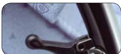
Ryggen justeres med gass via håndtak bak på stolen.