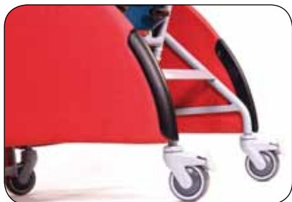
Gummihjul som sparer underlaget. Stolen fås også med store hjul.