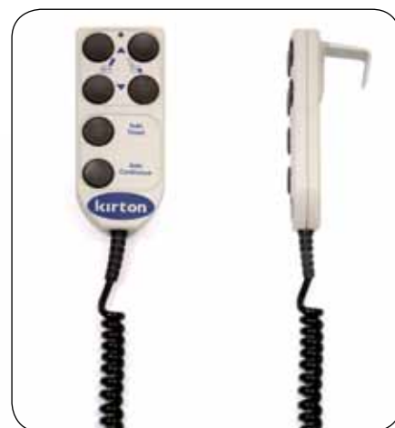
Styreenhet med store knapper.

REFLEXION materiale i hele stolen for brukerens kontaktflate.