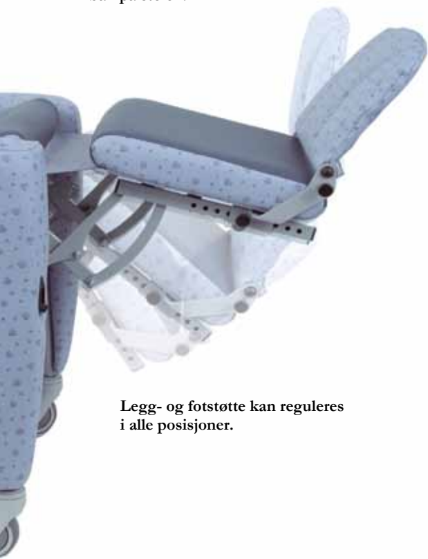
Legg- og fotstøtte kan reguleres i alle posisjoner.