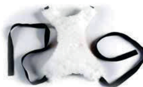
Bekkenbelte i fleece. (kan skaffes uten fleece)