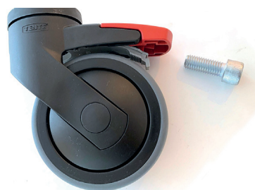
Hjul med brems og bolt.