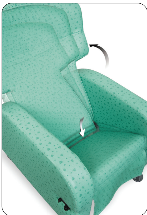
Ved tilting av stolryggen forskyves seteenheten uten at avstanden til gulvet blir endret.