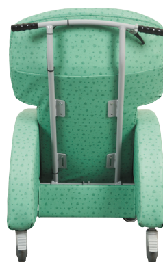
Ergonomisk plassert skyvehåndtak.