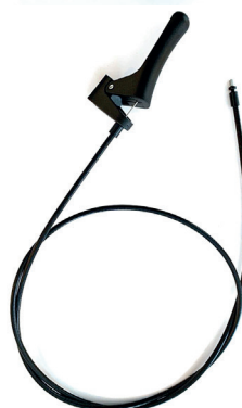
Wire med håndtak