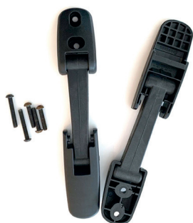
Brakett for feste av skammel til stol.