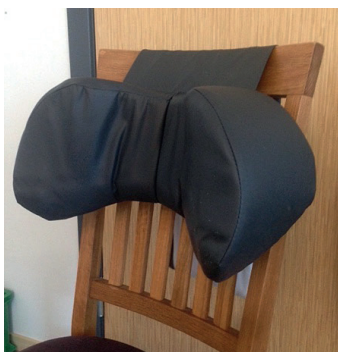
Universal hodestøtte med sandsekk.