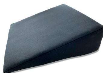
Kilepute for sete