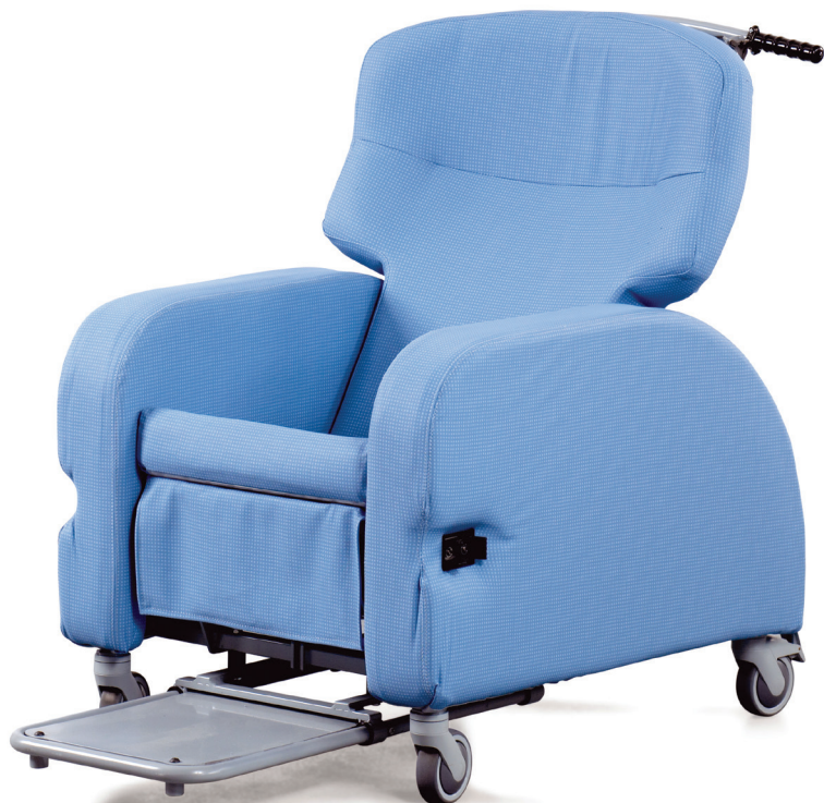
Omega med «sliding» fotbrett