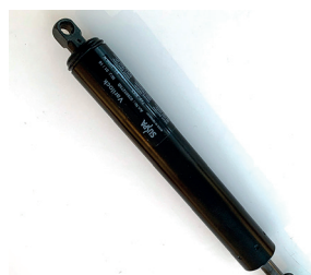
Gas-sylinder for ryggregulering.